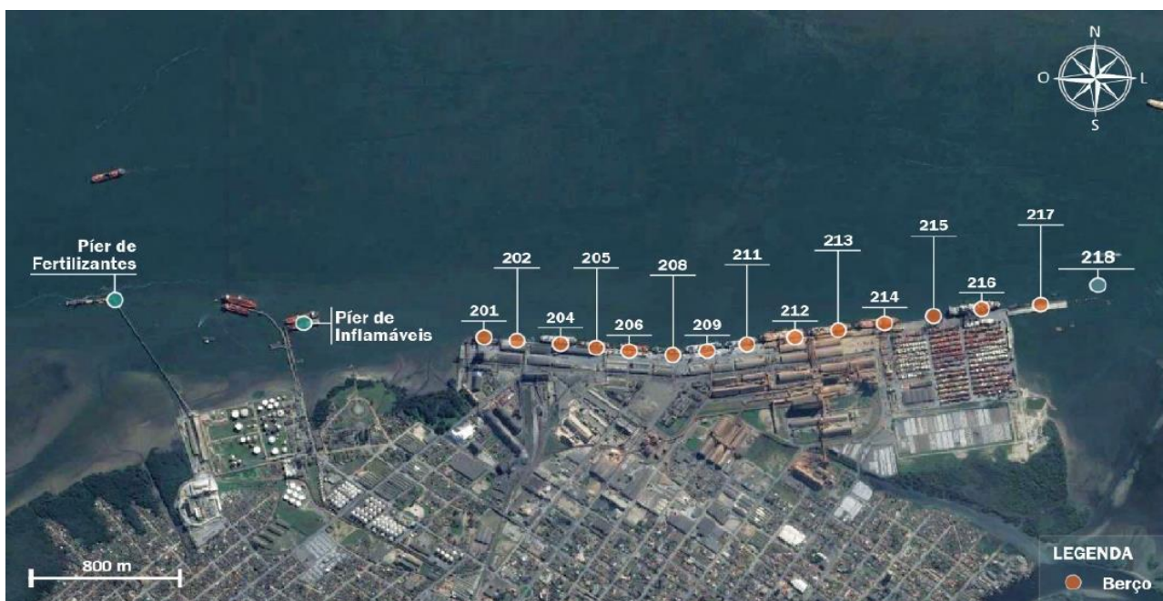
Figura 2: Localização dos Berços e Píeres do Porto de Paranaguá.

O porto dispõe de um cais público acostável, contínuo e com extensão de 3.131 m, com 14 berços para atendimento simultâneo de 12 a 14 navios, 1 berço de atracação para operações roll on-roll off com 220 m de extensão, o qual compreende 3 dolphins de atracação e 1 de amarração, totalizando aproximadamente 3.400 metros acostáveis de cais. A imagem a seguir demonstra a localização dos berços no Porto de Paranaguá.