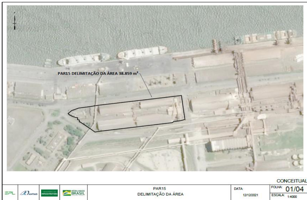
Figura 7: Localização área de arrendamento PAR15 no Porto de Paranaguá.

A figura a seguir apresenta imagem aérea da área de arrendamento PAR15 .